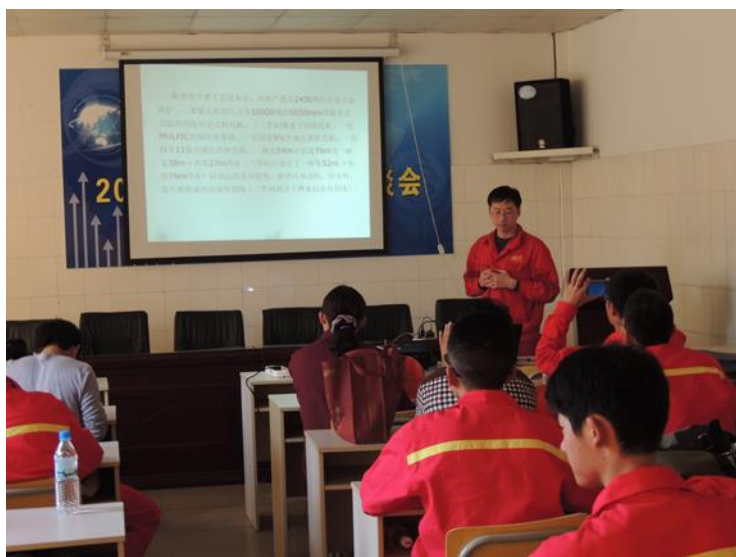
图7 沙工老师为沙钢一线技术人员学历教育授课

从2013年到目前为止，沙工共为沙钢一线技术人员开设了高起专成人学历教育共5届，分别开设机电一体化技术、冶金技术等专业，共为沙钢和控股公司永钢培养307名成人专科毕业生。