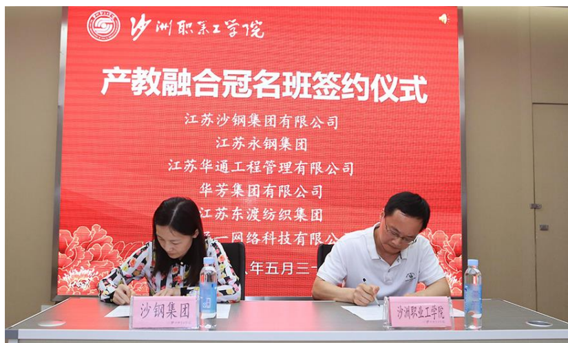
图3 2018年沙钢与沙工产教融合冠名班签字仪式

7、2018年5月，公司与沙工签订协议，以现代学徒制人才培养模式成立“产教融合沙钢冠名班”进行专项人才培养，其中机电一体化技术专业成为首批冠名班。