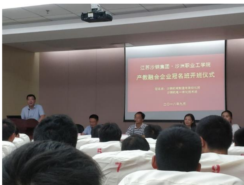
图4 沙钢冠名班开班仪式

沙钢集团有限公司本着“产教融合、校企共赢”的合作理念，在现代学徒制人才培养的基础上，先后组建了冶金机械专业订单班、冶金技术专业订单班和机电一体化技术专业沙钢冠名班等，从人才培养方案、课程设置、奖学金设立、教师互聘、实习实训等各个环节开展合作。